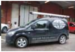
VW Caddy Skåp DSG 1.6 | TDI CR 102hk