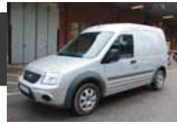
Ford Transit Con Van 1.8 TDCi 110 Trend LWB