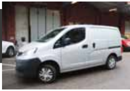
Nissan NV200 1,5 dCi 110 hk Premium