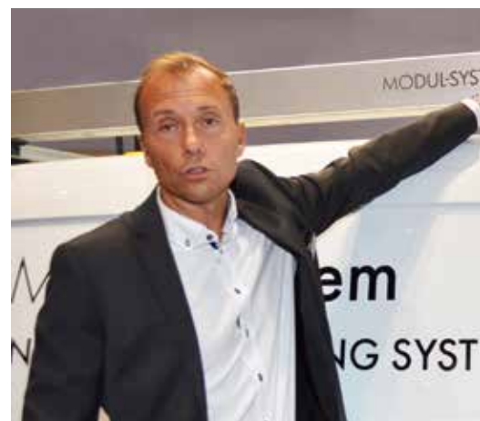
Efter att tidigare varit återförsäljare för ett känt märke har Modul-System nu tagit fram en egen serie lastbärare vilka monteras i befintliga infästningar på hantverkarnas bilar.

Man har också tagit fram en speciell verktygslåda vilken är större än de som man tidi-