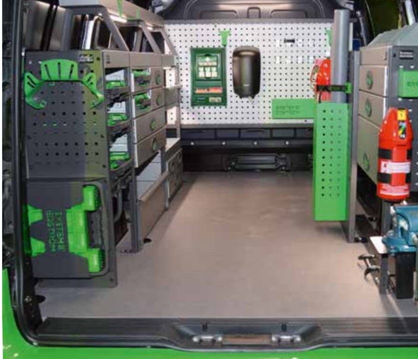
Med ny logotype, en grönare grön färg på tillbehören och reflekterande grått på övriga produkter framhåller System Edström sina hantverkarinredningar.