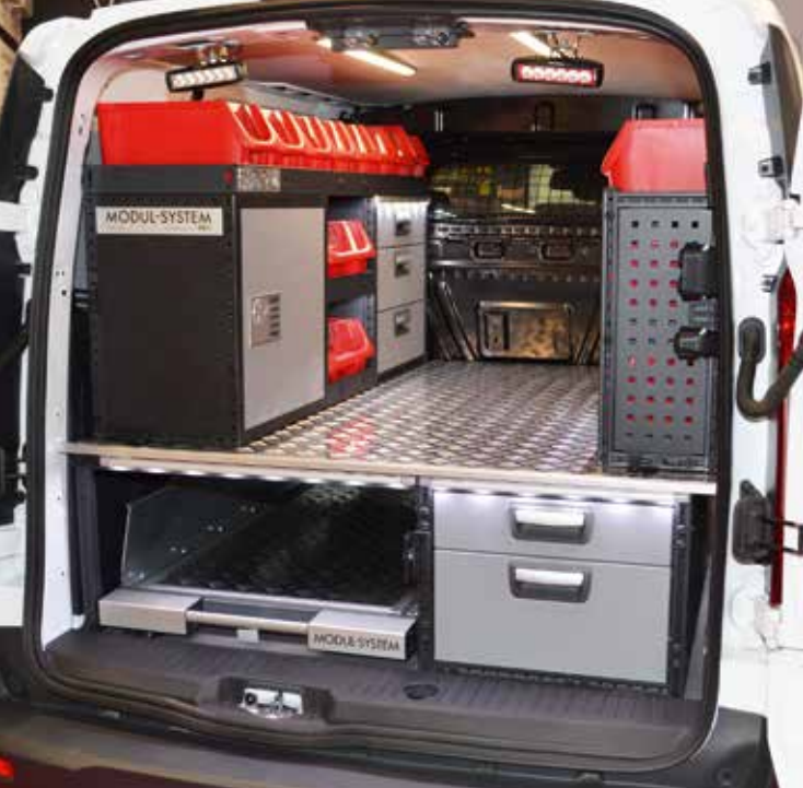
En praktisk hantverkarinredning från Modul-System. Notera lösningen med dubbelgolv, stora lådor under samt en utdragbar släde. En alltmär populär lösning.