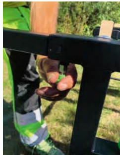
Snäppfäste för snabbjustering

Plus: Storleken utvikt 1800 x 2100 och hopvikt för transport 1150 x 250 x 700. Möjligheten att luta och räta upp bordet för att utan hjälp kunna lasta på en skiva. Smidigt och lätt att flytta. Hjul med låsfunktion.