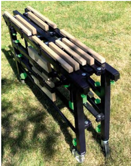
Ihopfällt mäter bordet 1150 x 250 x 700 mm