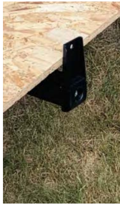
Vridbart anhåll för lastning av skiva i lutande ställning