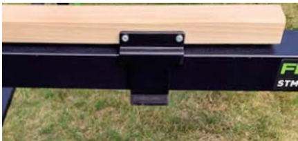
Distansklotsar lite låga för att riskera att säga i metall