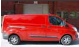
1. Ford Transit Custom