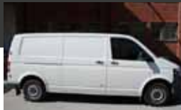
2. VW Transporter