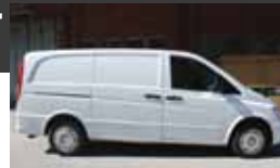
3. Mercedes-Benz Vito